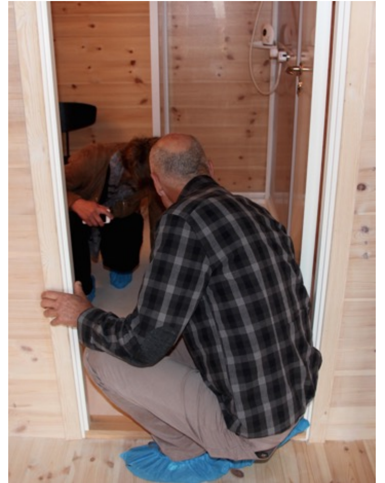
Huset blev inspiceret.