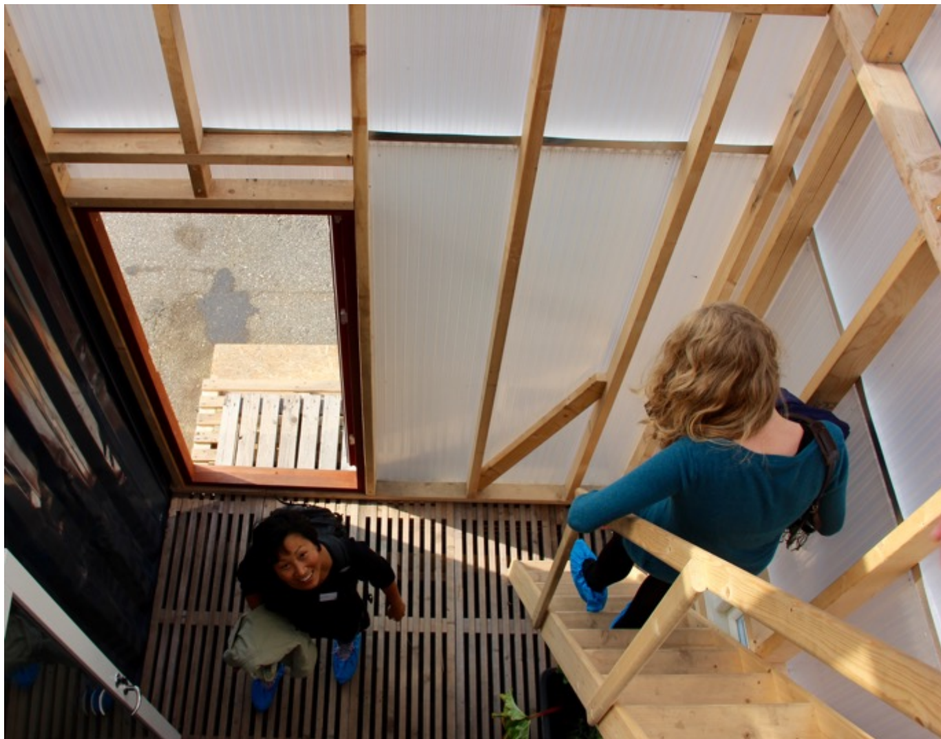
Drivhuset, der i mørket fungerer som lanterne.