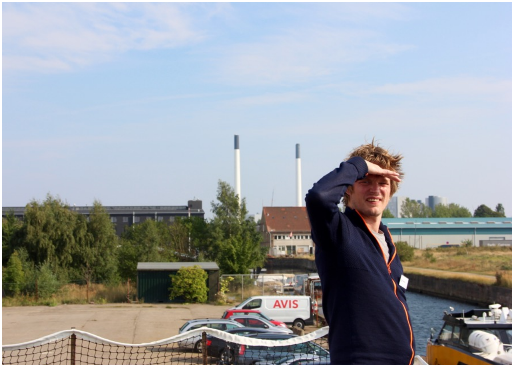
Perfekt udsigt til Den lille havfrue.